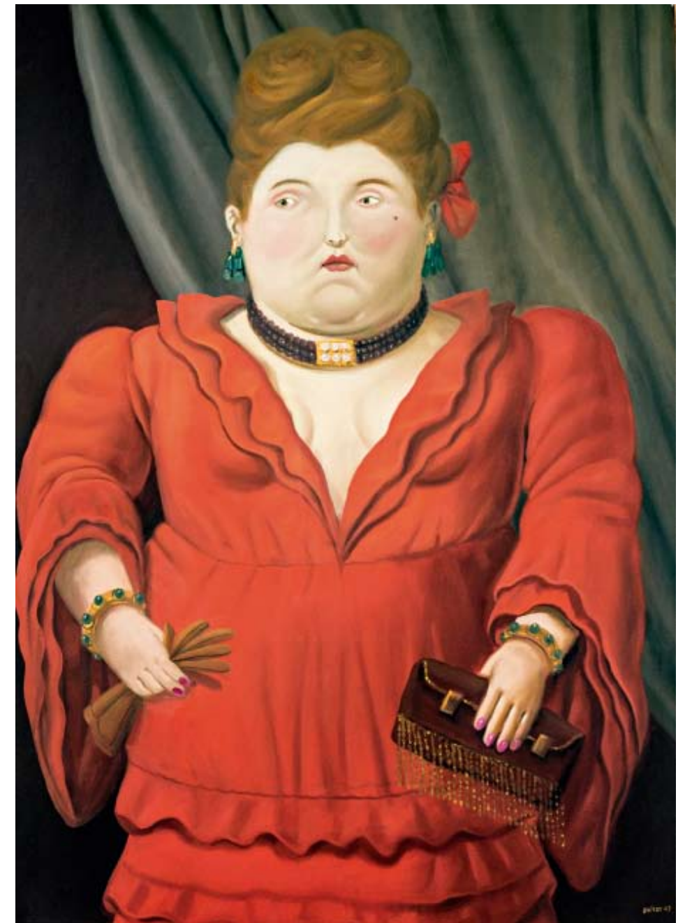
《交际花》布面油画 2003年

博特罗一直以来被认为是当今世界上最多产的艺术师之一。与之对应，博特罗的绘画内容也丰富多样。他出生在哥伦比亚的一个小城市麦德林 (Medellin)。从自己的家乡到更广阔地区的拉美文化，从宗