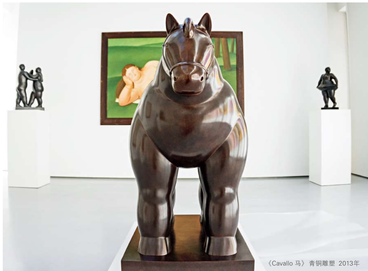
《Cavallo 马》青铜雕塑 2013年

Art画廊的资深艺术顾问孙菁说：“博特罗笔下的女性独立坚强，镇定自若，和传统西方笔下柔软圆滑的形象不同，他回溯西方传统的内容，但在表达方式上大胆探索，并很出色地用自己的艺术语言翻译了笔下形象。”